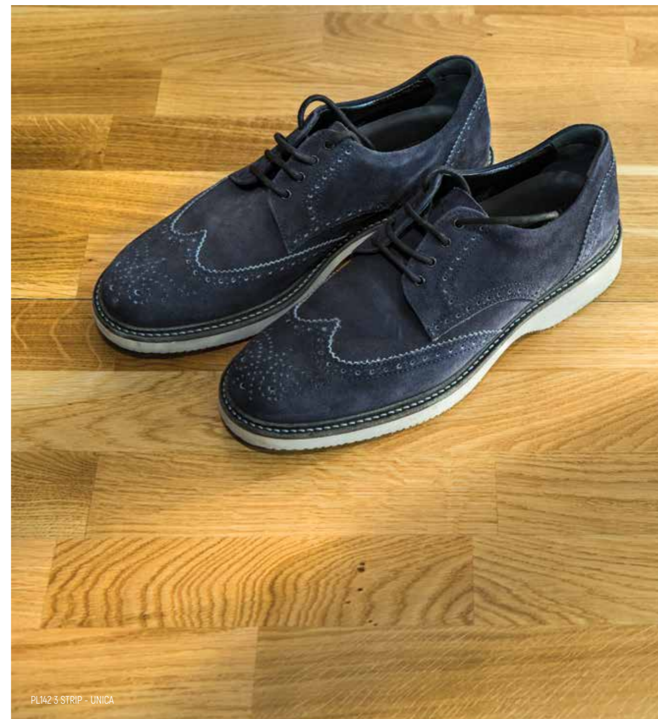
PL142 3 STRIP - UNICA